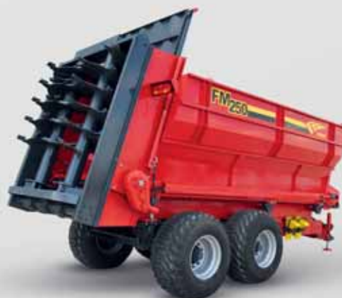
25 ТОННЫЙ РАЗБРАСЫВАТЕЛЬ FMGR 25