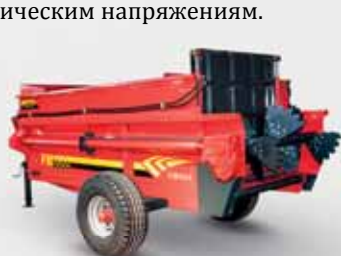
4 ТОННЫЙ РАЗБРАСЫВАТЕЛЬ FMGR 3

4- Система взвешивания доступна для моделей FMGR 18 и FMGR 25.