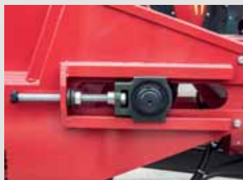
Система натяжения цепи