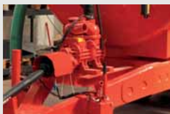
Мощные итальянские насосы