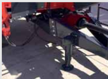
домкрат с насосом