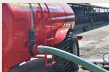
Ручная система всасывания