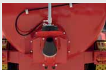
Регулируемая насадка для разлива