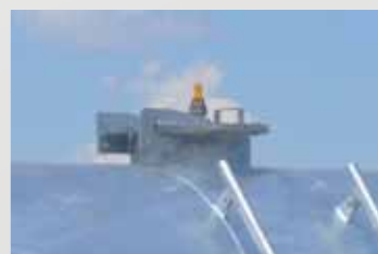
Клапаны высокого давления