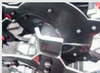
Специально разработанные лезвия