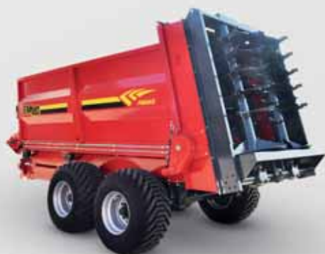
18 ТОННЫЙ РАЗБРАСЫВАТЕЛЬ FMGR 18