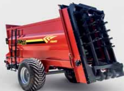
10 ТОННЫЙ РАЗБРАСЫВАТЕЛЬ FMGR 10