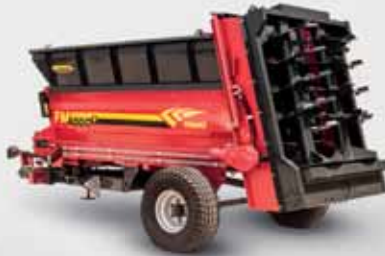
5 ТОННЫЙ РАЗБРАСЫВАТЕЛЬ FMGR 5