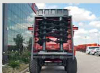
Специально разработанные битеры