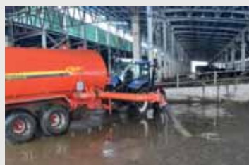
Гидравлическая система всасывания